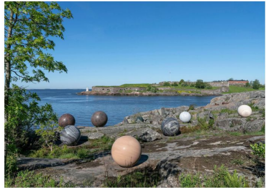
Alijca Kwaden veistos Pars pro Toto (2018) on Kustaanmiekkan salmen viereisillä kallioilla.