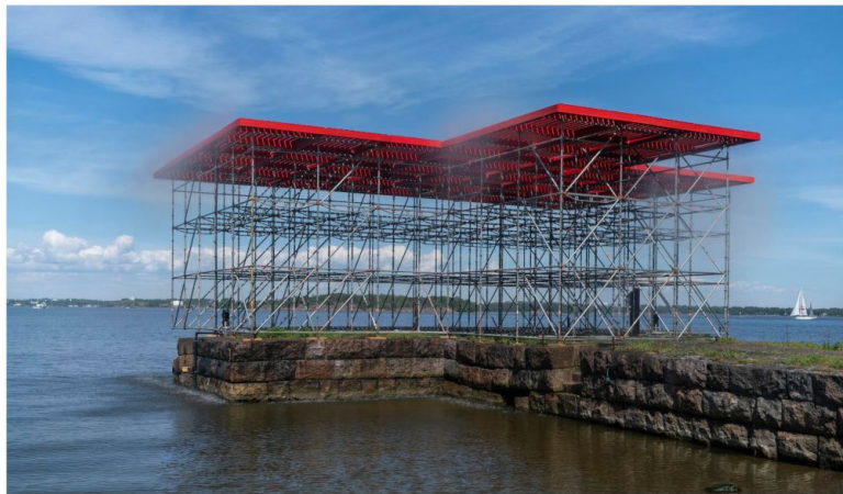
Jaakko Niemelän Laituri 6 (2021) näyttää, mille korkeudelle merenpinta nousee, jos Grönlannin pohjoinen jääpeite sulaa.

filmistä ja vr-elokuvasta koostuvan teoksensa Seitsemän vankia (2020) yhteistyössä Suomenlinnan avovankilan kanssa. Molemmissa keskeisiä ovat vankien ajatukset vapaudesta ja vankeudesta. Osat täydentävät toisiaan: siinä missä dokumentaarinen osuus sukeltaa syvemmälle teemoihin, vr-elokuvaa katsoessa tempautuu keskelle tapahtumia.