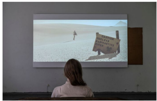
Wanuri Kahiun Pumzi (2009) on dystooppinen lyhytelokuva.