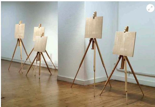
Minna Kangasmaa: The Lofty Message of Landscape I-V, 2013, puiset kenttätelineet, valokuvat kaiverrettu vanerille.